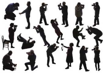
PHOTO ADHÉSION 2023/2024

Carte valable du 1er septembre 2023 au 31 août 2024*